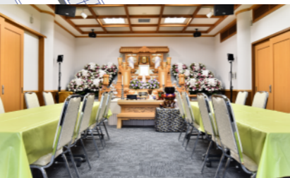
●1階ホール内 約25席 1階のみのご利用も可能です。 ※祭壇前で会食をする場合は16名様まで可能です。