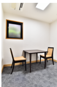
●階司式者控室 ご家族の方や、僧侶の控室として ご利用いただけます。