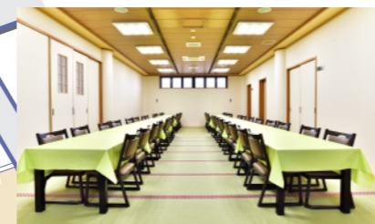
●2階和室(36畳) 約48席 祭壇を飾った場合は32名様まで 会食ができます。 ※仮眠される方の入浴施設も完備 しております。