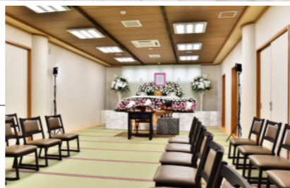
●2階和室(36畳) 32席 ※2階のみのご利用も可能です。 ※祭壇は料金に含まれません。 ※放送設備はありません。